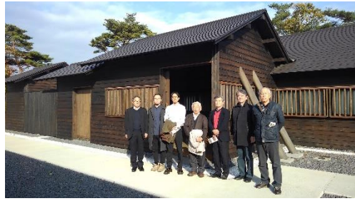
創業小屋で記念撮影